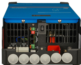
MultiPlus 2000 VA (sin cubierta inferior)